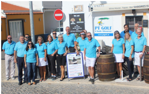
PT Golfgänget i Östra & Centrala Algarve