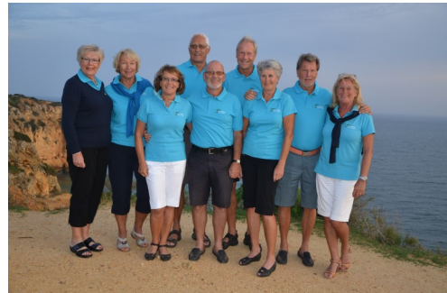
PT Golfgänget i Västra Algarve