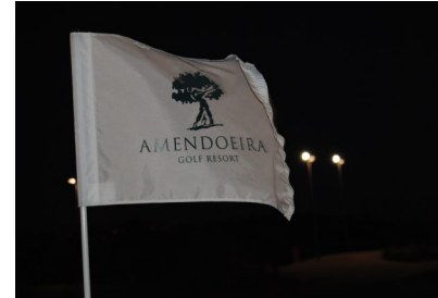
På underbara Oceanico Amendoira Golf Resort kan PT Golfgästerna spela golf både dag och natt