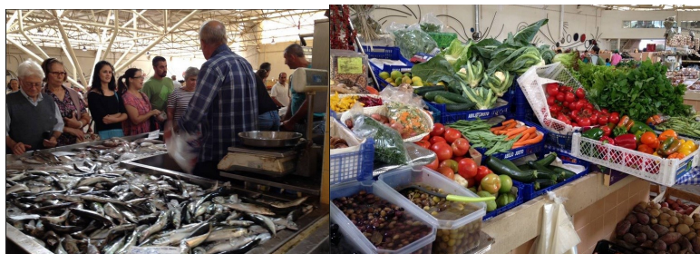
Längs hela algarvekusten finns marknader med färsk fisk och grönsaker från lokala bönder och fiskare. Allt till mycket rimliga priser.