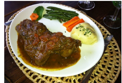
Vingårdsbesök från produktion till provsmakning och sedan avnjutning tillsammans med lammskuldra