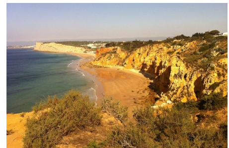
Promenadväg längs hav och klippor i västra Algarve